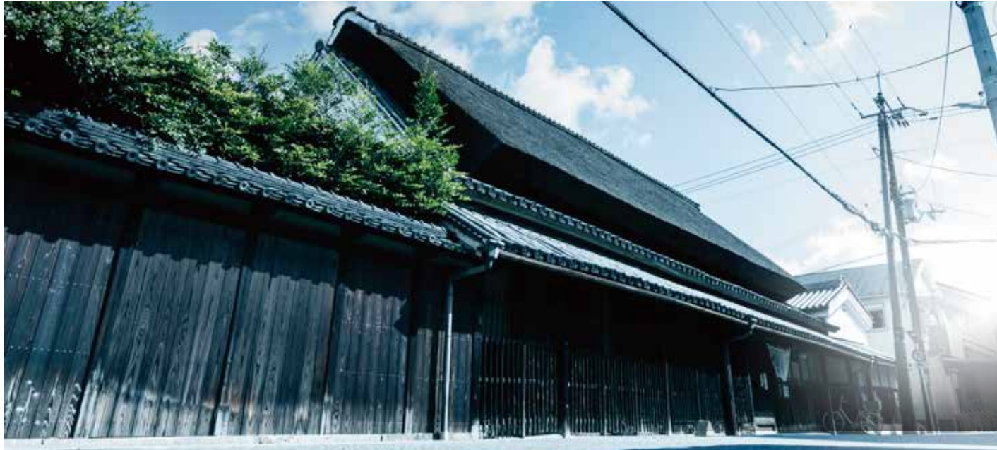
興長商榷林堂(徒歩3分・約220m)

駅前立地でありながら、「第1種住居地域」に位置し、 便利と閑静な住環境が共存する、希少価値の高い地。