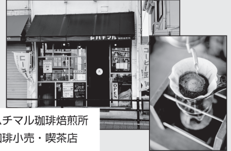
店舗名：ハチマル珈琲焙煎所 業種：珈琲小売・喫茶店